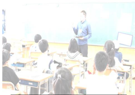
外国語活動（ALTとの授業）