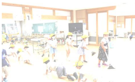
朝清掃（クラスの友だちと）