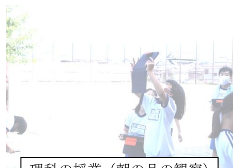
理科の授業（朝の月の観察）