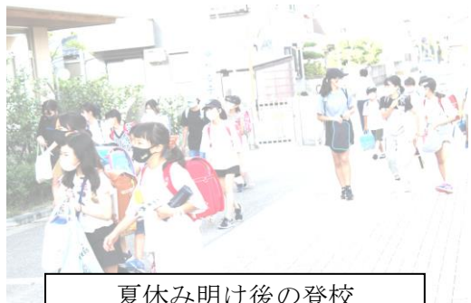
夏休み明け後の登校