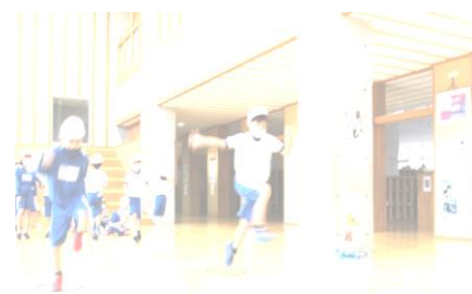
体育の授業（走り幅跳び）