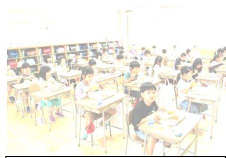
給食（みんなでいただきます）