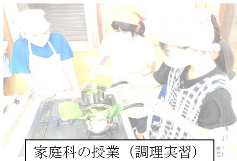
家庭科の授業（調理実習）