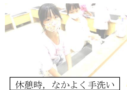
休憩時、なかよく手洗い