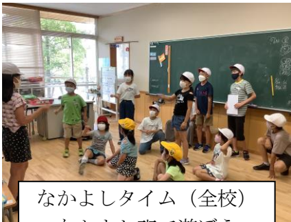
なかよしタイム（全校） なかよし班で遊ぶ