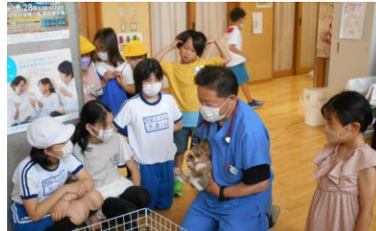
ウサギのモフちゃん健康診断 （下山動物園委員会）