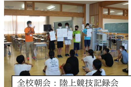
全校朝会：陸上競技記録会 表彰（6年生）